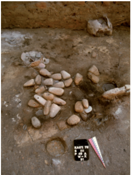
Abb. 4: Webgewichte aus Kastanas (in situ). Fig. 4: Loom weights from Kastanas (in situ)

Die Spinnwirtel (Abb. 2) und Webgewichte (Abb. 3) der drei jeweils repräsentativsten Fundorte dieser Regionen wurden analysiert und miteinander verglichen. Die Streudiagramme zeigen, dass die nordgriechischen Wirtel im Durchschnitt am größten/schwersten sind, was darauf schließen lässt, dass die damit gesponnenen Fäden dicker/gröber waren als die weiter südlich hergestellten. Sowohl auf Kreta als auch in Zentralgriechenland hat man überwiegend feine Fäden verwebt, was insbesondere die frappant leichten Webgewichte der Argolis verdeutlichen.