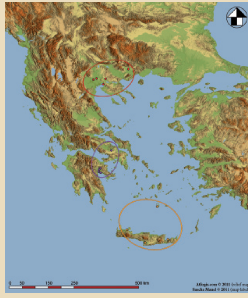
Abb. 1: Griechenlandkarte mit den drei untersuchten Regionen (Copyright © Atlogis.com (Reliefkarte) & Sascha Mauel (Kartenerweiterungen)). Fig. 1: Map of Greece with the three investigated regions (Copyright © Atlogis.com (relief map) & Sascha Mauel (map enhancement)).

In meinem Dissertationsprojekt widme ich mich den Gemeinsamkeiten und Unterschieden maßspezifischer und morphologischer Merkmale von Textilgeräten, die aus dem 2. Jahrtausend v. Chr. sowie aus drei miteinander zu vergleichenden griechischen Regionen stammen. Es offenbaren sich interessante Aspekte einer Gewichts- und Formendiversität zwischen Nord- und dem übrigen Griechenland, die zur einschlägigen Erforschung der bronzezeitlichen Textilproduktion in der Balkanregion beitragen mögen.